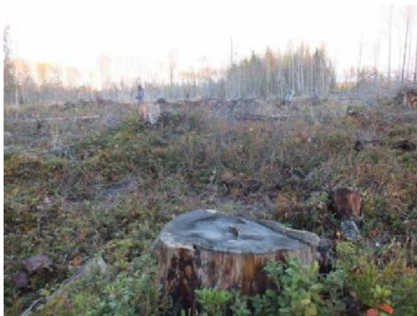
Рис. 1.3. Вырублена буферная зона «облесенного болота»