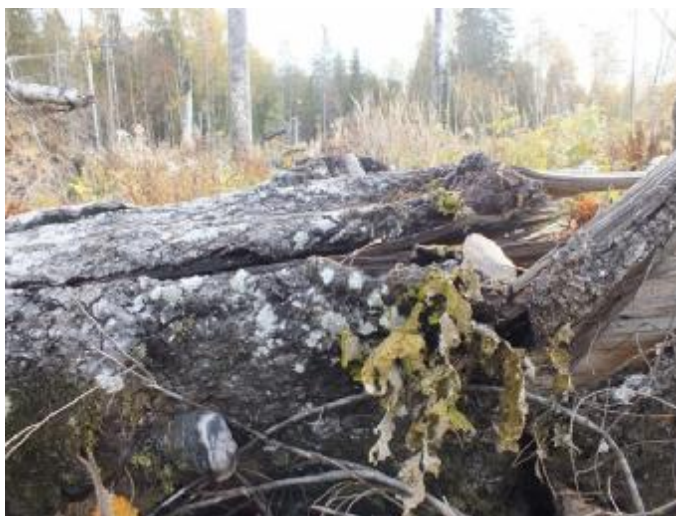
3.2. Нарушено местообитание Лобарии легочной