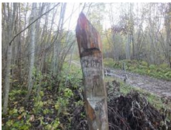
Рис. 1.1 Рубочный столб

Наличие нарушений принципов и критериев FSC: 1) нарушено местообитания краснокнижного вида Лобарии легочной; 2) уничтожение ключевого биотопа – вырублена буферная зона «облесенного болота» (рис. 1.3.).