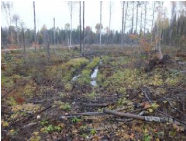
Рис. 1.2. Повреждение почвы