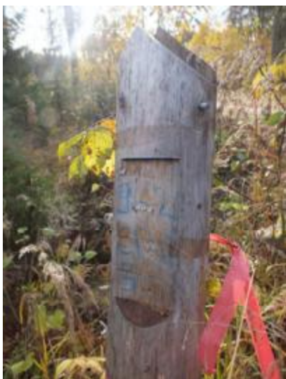
Рис. 5.1. Рубочный столб

Наличие нарушений принципов и критериев FSC : 1) уничтожение местообитания краснокнижных видов: Лобария легочная, и Неккеры перистой, Ежевика коралловидного; 2) уничтожение ключевого биотопа - вырублена буферная зона «облесенного болота» (рис. 5.3.).