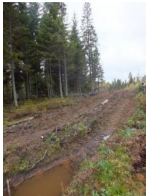
4.2. Повреждение почвы