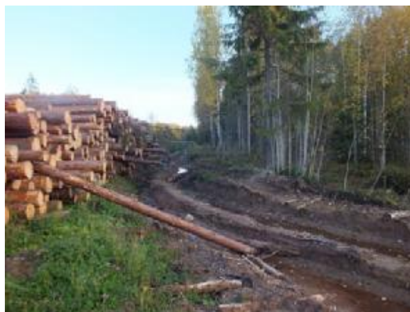
Рис. 6.2. Повреждение почвы