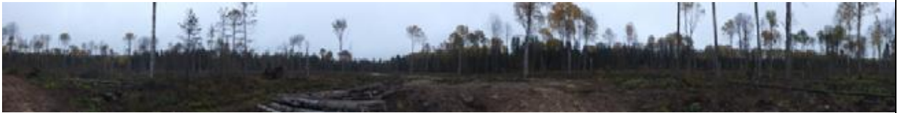
Рис. 1.1. Общий вид рубки

Наличие нарушений принципов и критериев FSC: 1) не сохранены ключевые элементы: старые деревья, деревья-ветераны, усыхающие деревья хвойных пород.