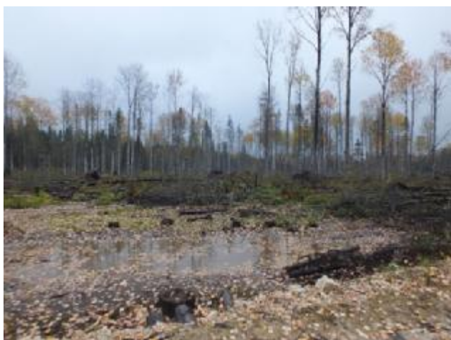
Рис. 6.1. Вырублено понижение

Наличие нарушений принципов и критериев FSC: 1) нарушено местообитания краснокнижных видов Лобарии легочной и Неккеры перистой; 2) вырублен биотоп - «Заболоченные участки леса в бессточных понижениях», повреждение почвы; 3) повреждение почвы – глубокие колеи (рис. 6.3.) 4) не сохранены ключевые элементы: старые деревья, деревья-ветераны, усыхающие деревья хвойных пород.