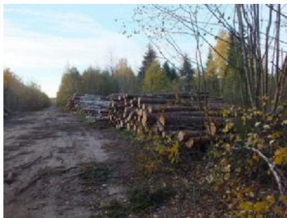
Рис. 6.1. Штабель ели и сосны у рубки

Наличие нарушений принципов и критериев FSC: 1) уничтожение ключевого биотопа – «Заболоченные участки леса в бессточных понижениях»; 2) повреждение почвы вдоль штабелей (рис. 6.2.); 2) не сохранены ключевые элементы: старые деревья, деревья-ветераны, усыхающие деревья хвойных пород (рис. 6.3.)