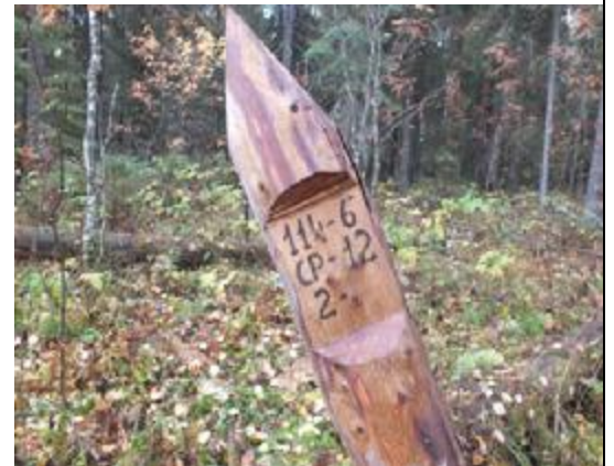
Рис. 1.3. Рубочный столб