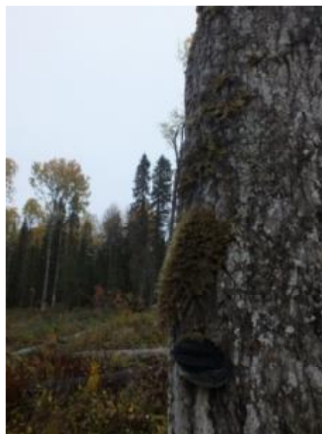
Рис. 1.4. Лобария легочная