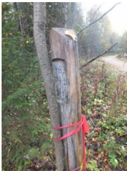
3.1. Рубочный столб

Наличие нарушений принципов и критериев FSC: 1) нарушено местообитание краснокнижного вида Лобарии легочной.