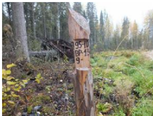
Рис. 5.2. Рубочный столб