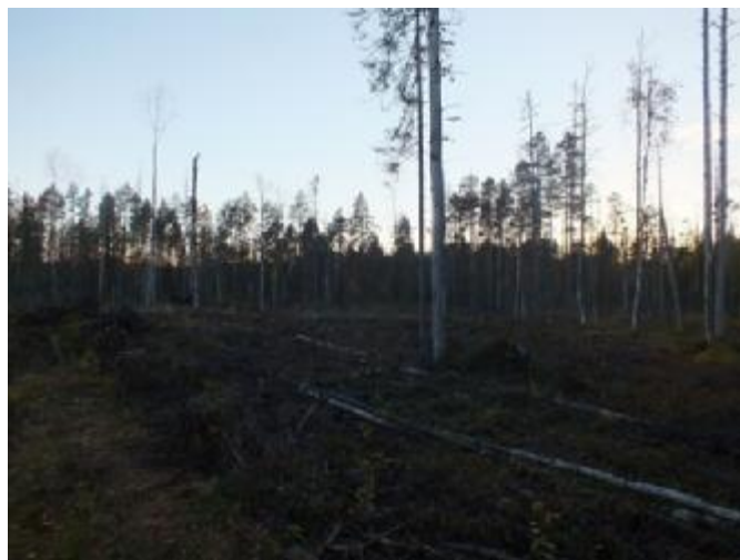
Рис. 1.2. Общий вид рубки