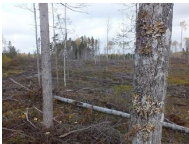
5.3. Вырублена буферная зона «облесенного болота»