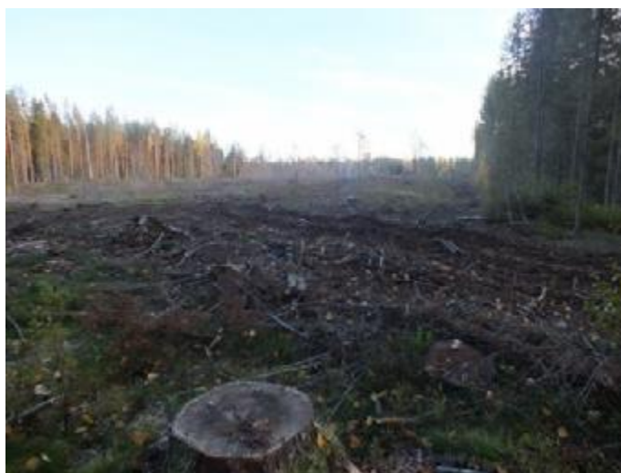
Рис. 6.3. Общий вид рубки