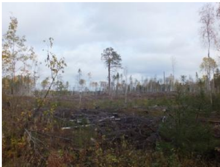
5.2. Общий вид рубки