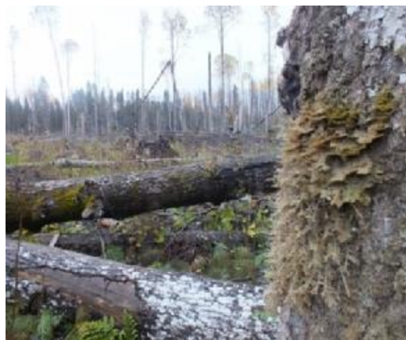
Рис. 6.4. Нарушено местообитание краснокнижных видов.