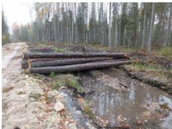
Рис. 5.1. Оставленный штабель ели

Наличие нарушений принципов и критериев FSC: 1) повреждение почвы (рис. 5.3.)