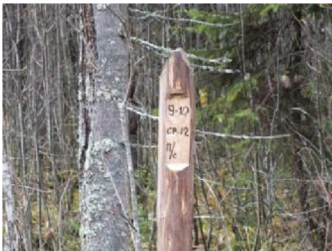
4.1. Рубочный столб

Наличие нарушений принципов и критериев FSC: 1) не сохранены ключевые элементы: старые деревья, деревья-ветераны, усыхающие деревья хвойных пород,