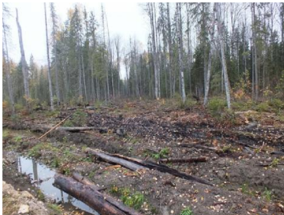
Рис. 5.3. Повреждение почвы