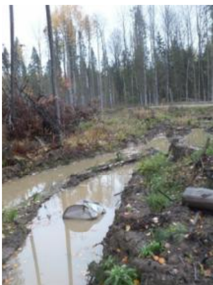
Рис. 6.3. Повреждение почвы