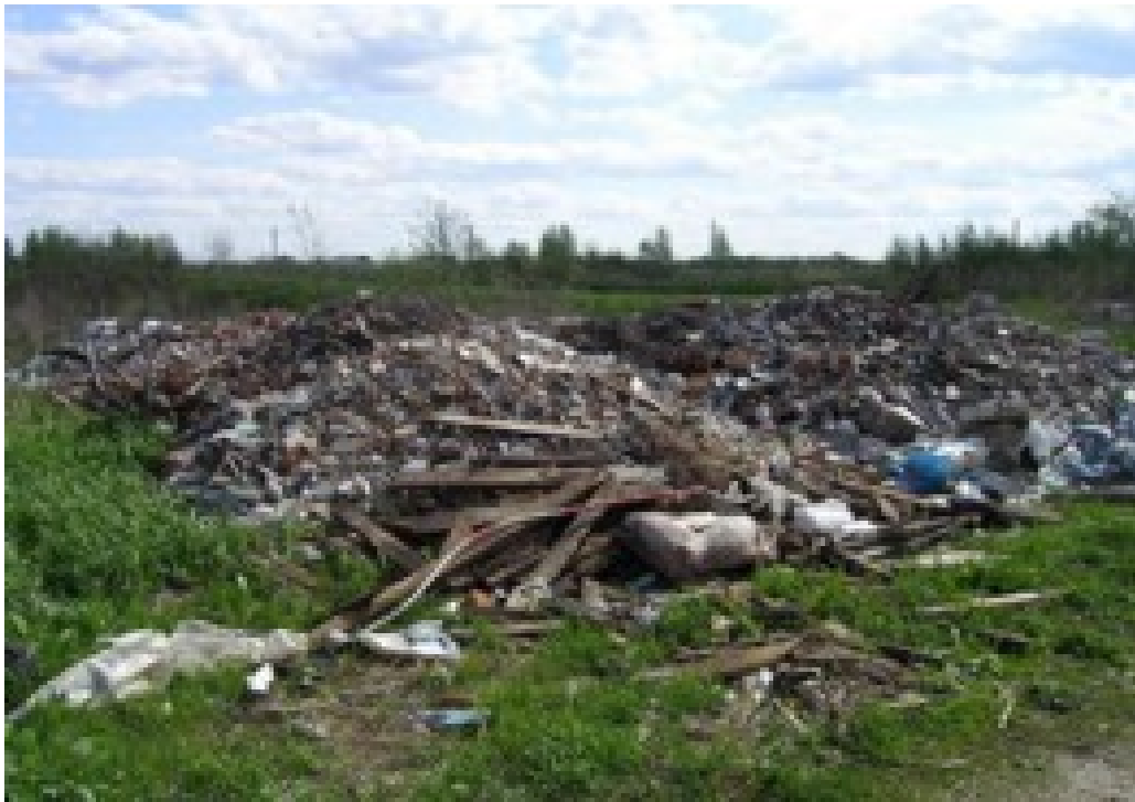
Фото: Свалка в окрестностях дер. Заболотье, Клишева и п. Новое