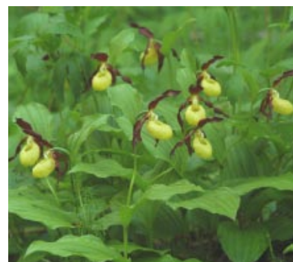
Венерин башмачок настоящий